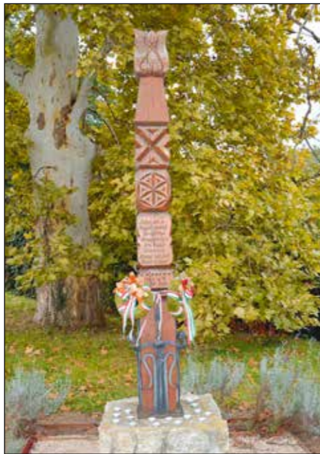
Nagy öröm számunkra, hogy e napon az iskola diákjai is velünk vannak és együtt emlékezhetünk.